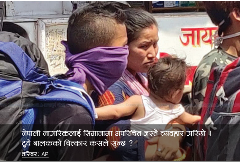
नेपाली नागरिकलाई सिमानामा अपरिचित जस्तै व्यवहार गरियो । दुधे बालकको चित्कार कसले सुन्छ ?

Coronavirus CivActs Campaign (CCC) सँ सरकार, सञ्चार माध्यम, संघसंस्था आ आम नागरिक बिचक सूचनाके दुरी कम कएक देशभैरसं संकलन कएलगेल हल्ला, नागरिकक जिज्ञासा आ प्रश्नसभ संकलन कए तथ्य पता लगाएक आम नागरिकके सूचित करैत अछि । एहिसं आम नागरिकक आवश्यकताके पहिचान करवाक साथे हल्लासभहक कोनो नकारात्मक असर पहुचावस पहिलेहि सान्दर्भिक तथ्य आम नागरिक सभमे प्रवाह कए जोखिम न्युनिकरण करैत अछि ।