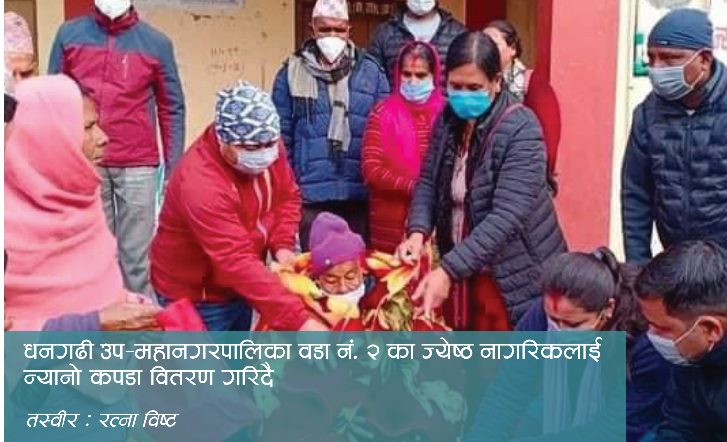
धनगढी उप-महानगरपालिका वडा नं. २ का ज्येष्ठ नागरिकलाई न्यानो कपडा वितरण गरिदै

“Gov-her-nance” महिलाको भूमिका, स्थानीय विकास र खुला सरकार सम्बन्धी विद्यमान समस्याको समाधान गर्ने हेतुले नयाँ आवाजलाई स्थान दिने एक पृथक अवधारणा हो । Gov-her-nance बुलेटिनले नेपाल भरिका विभिन्न समुदायबाट संकलन गरिएका हल्ला, नागरिकका जिज्ञासा तथा प्रश्नहरू संकलन गरी तथ्य पत्ता लगाएर आम नागरिकलाई सूचित गर्दछ । हामी यस बुलेटिनको माध्यमबाट महिला तथा लैंगिक अल्पसंख्यकका मुद्दालाई बाहिर ल्याएर धनगढी उप-महानगरवासी र उप-महानगरपालिका बिचको सूचनाको दुरी कम गरी लैंगिक मैत्री उप-महानगरको अवधारणालाई साकार पार्ने लक्ष राख्दछौं ।