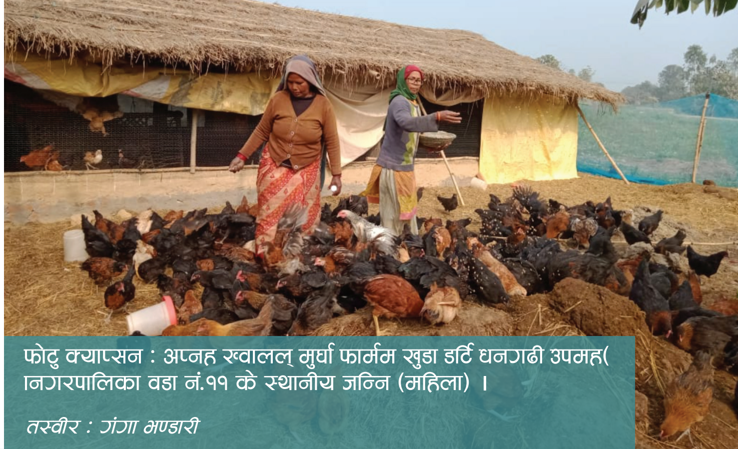
फोटु क्याप्सन : अप्णह ख्वालल् मुर्घा फार्मम खुडा इर्ति धनगढी उपमह(नगरपालिका वडा नं.११ के स्थानीय जन्नि (महिला) ।

“Gov-her-nance” बुलेटिन, धनगढी उप-महानगरपालिकाक कैंयो समुदायमसे सिमवाटल हल्ला, नागरिक हुकनक जिज्ञासा ओ प्रश्न सिमोदक तथ्य पता लगाक, सक्कु नागरिक हुकन सूचित कर्ना काम कर्ता । हम्न यी बुलेटिनके माध्यमसे महिला (जन्निनक) ओ लैङ्गिक अल्पसंख्यकक मुद्दाहन बाहेर लावक उपमहानगरवासी ओ उपमहानगरपालिकाबीचम रहल सूचनक दूरी कम कराक लैङ्गिकमैत्री उपमहानगरके अवधारणह पूरा कर्ना लक्ष्य लेल बाटी ।