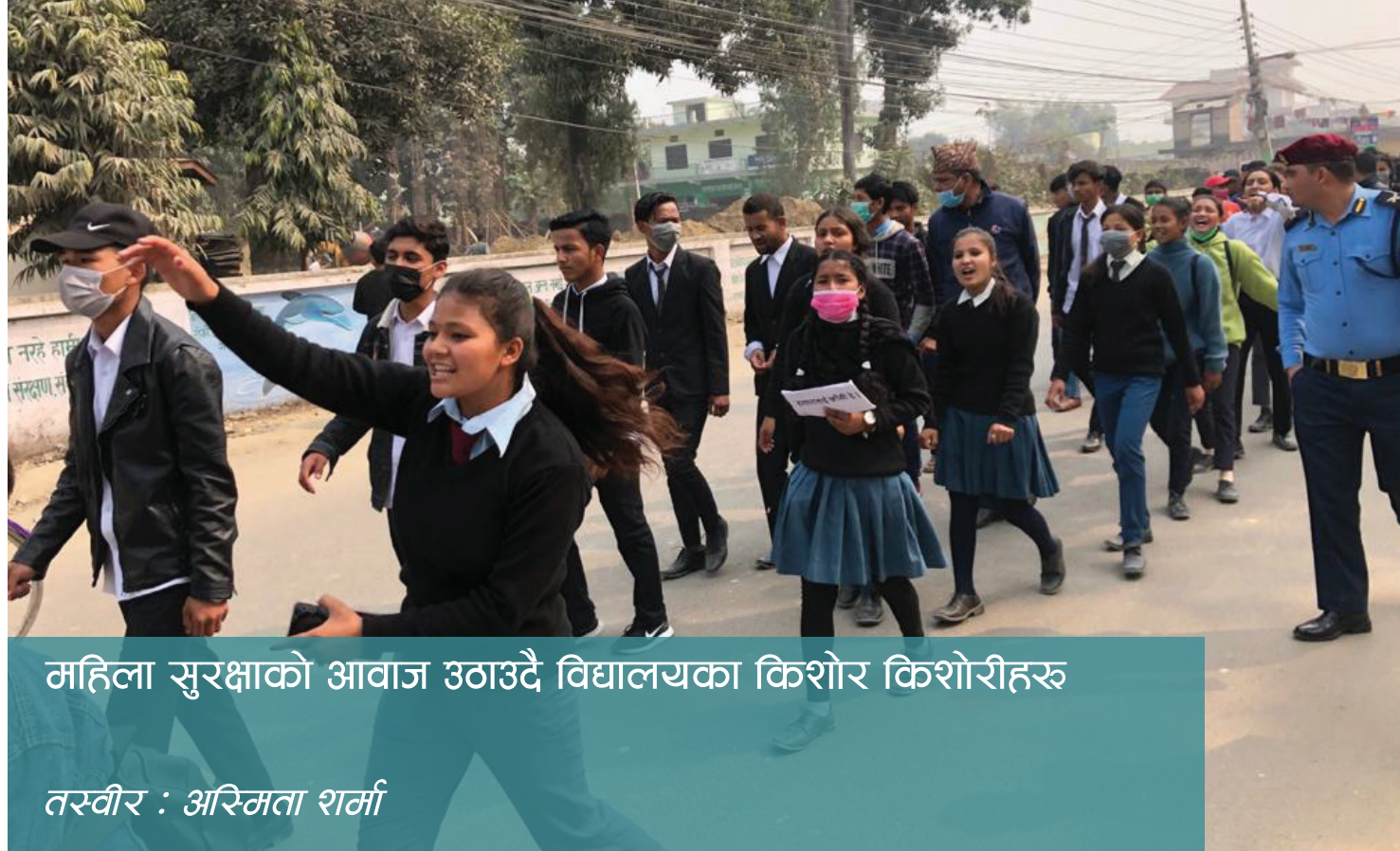
महिला सुरक्षाको आवाज उठाउँदै विद्यालयका किशोर किशोरीहरू

“Gov-her-nance” महिलाको भुमिका, स्थानीय विकास र खुला सरकार सम्बन्धी विद्यमान समस्याको समाधान गर्ने हेतुले नयाँ आवाजलाई स्थान दिने एक पृथक अवधारणा हो । Gov-her-nance बुलेटिनले नेपाल भरिका विभिन्न समुदायबाट संकलन गरिएका हल्ला, नागरिकका जिज्ञासा तथा प्रश्नहरू संकलन गरी तथ्य पत्ता लगाएर आम नागरिकलाई सूचित गर्दछ । हामी यस बुलेटिनको माध्यमबाट महिला तथा लैंगिक अल्पसंख्यकका मुद्दालाई बाहिर ल्याएर घनगढी उप-महानगरवासी र उप-महानगरपालिका बिचको सूचनाको दुरी कम गरी लैंगिक मैत्री उप-महानगरको अवधारणालाई साकार पार्ने लक्ष राख्दछौं ।